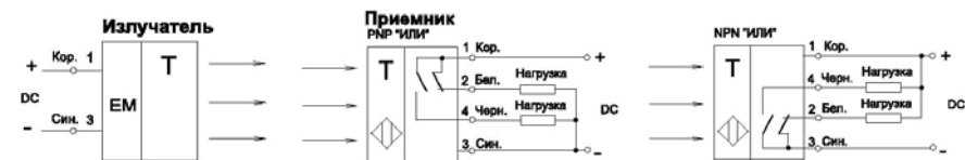
Приемник PNP НО